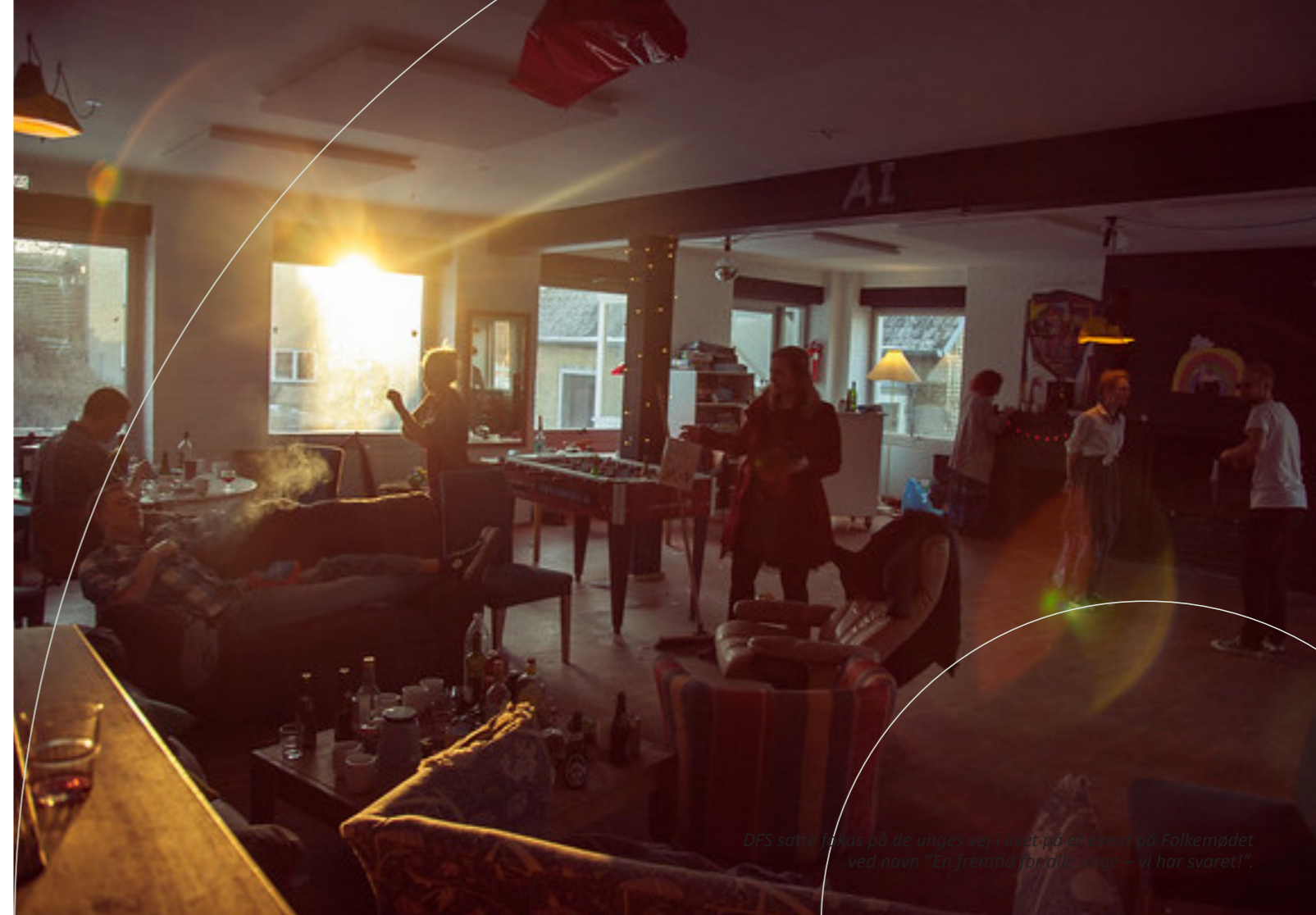
DFS som fokus på de unges vej i livet på et møde med Folkemødet ved navn ”En fremtid for alle unge – vi har svaret!”

I oktober indgik Regeringen og SF, Radikale Venstre og De Konservative en politisk aftale – ”Ungeløftet” – der skal hjælpe med at løfte de ca. 43.000 unge, som hverken er i uddannelse eller har et arbejde.